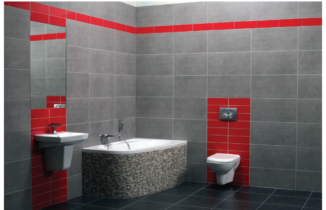
Dzięki zastosowaniu specjalnej formuły SilicaActive, fuga CE 40 posiada trwałą i intensywny kolor