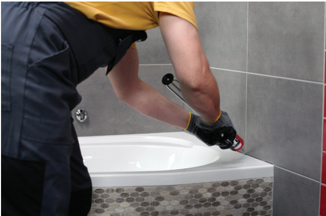
Połączenia urządzeń sanitarnych z okładzina należy wypełniać przy użyciu silikonu sanitarnego